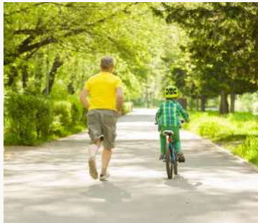
1KM de Ciclopista