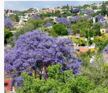
10,000m 2 áreas verdes